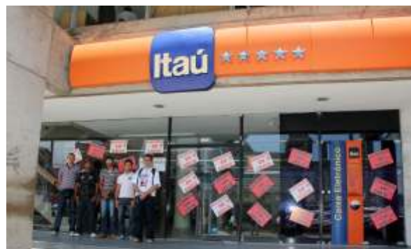
Com o amparo jurídico do TRT, a greve se fortaleceu no Itaú