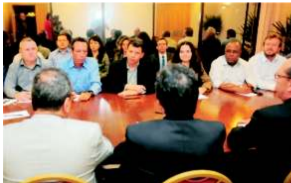
Negociação com a Fenaban foi tensa e proposta saiu na marra