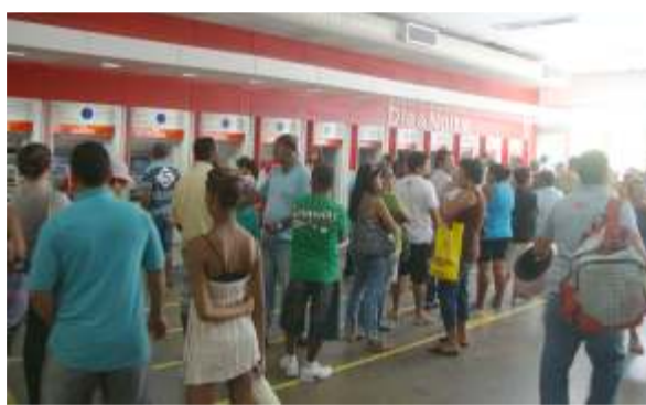
Por culpa dos bancos, usuários sofreram no autoatendimento