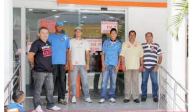
Apoiadores ajudaram o Sindicato na paralisação