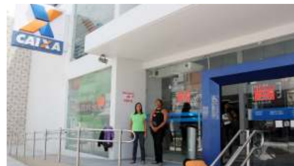
Nas assembléias e nos piquetes, a participação dos bancários de Alagoas foi fundamental para o sucesso da greve