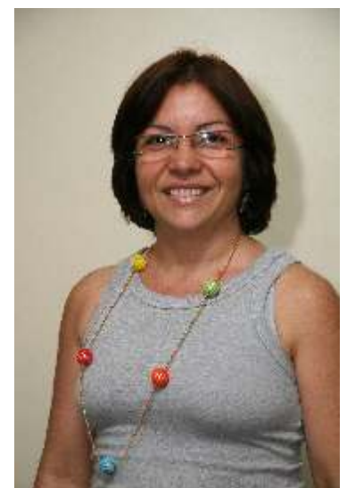
Arivoneide - Nº 503

ARIVONEIDE, Nº 503, é candidata pelo Time da ANABB, que reúne combativos e experientes colegas do movimento sindical bancário, responsáveis por várias conquistas da Associação. Funcionária do BB há 28 anos, a candidata também tem um histórico de vida dedicado à luta dos empregados do banco e dos bancários em geral. Atualmente é diretora do Sindicato dos Bancários de Alagoas, secretária da Mulher Trabalhadora da CUT-AL e membro do Conselho de Usuários da Cassi-AL.