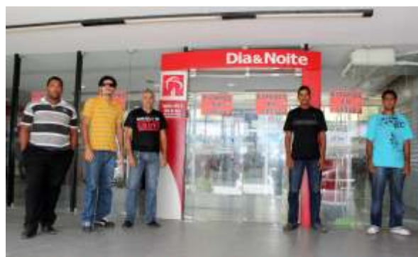
Dia & Noite, o Bradesco não teve trégua.