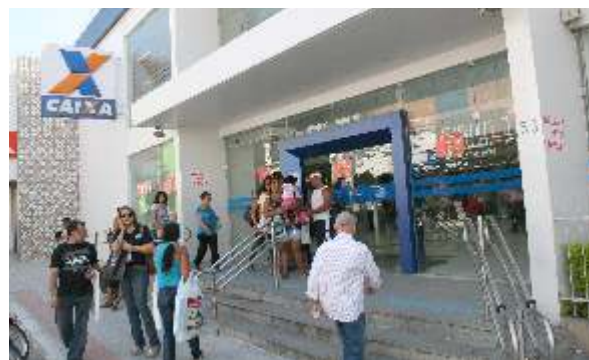
Greve respeitou os clientes, que tiveram acesso às agências