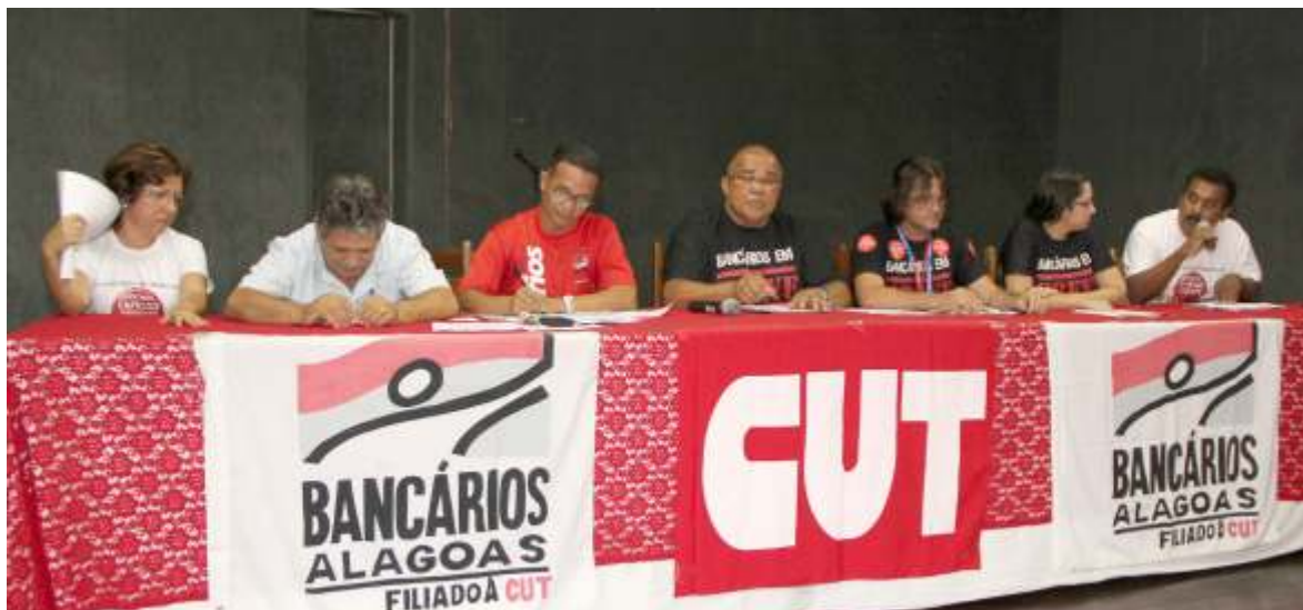
Homenagem foi reiterada pela CUT e membros da diretoria do Sindicato, que conduziram as assembléias e a greve

“A sua luta valeu, companheiros! Fizemos a maior greve dos últimos 20 anos”, dizia a faixa.