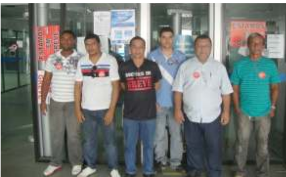
Comissões ajudaram a consolidar a paralisação na Caixa