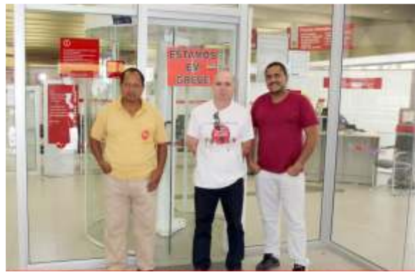
Sem os interditos, greve nos bancos privados foi tranquila