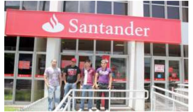
Santander ficou parado do 1º ao último dia