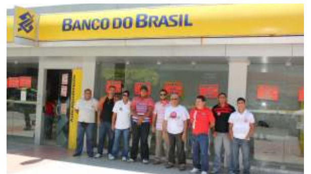
Paralisação do prédio central do BB fortaleceu o movimento