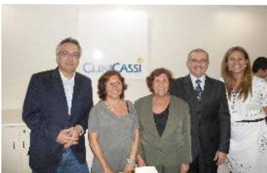
Representantes da Cassi e do BB na inauguração da sede

Com firme determinação e espírito de luta, os bancários lotados no interior de Alagoas deram substancial contribuição à greve da categoria, o que resultou no fechamento de 80% das agências, um dos maiores índices alcançados nos últimos anos. Além de cruzarem os braços, os colegas montaram piquetes e comissões de convencimento, conseguindo fechar até bancos privados. Arapiraca, mais uma vez, liderou as ações de organização e mobilização na região agreste, realizando, entre outras atividades, um protesto conjunto dos bancários com os trabalhadores dos Correios.