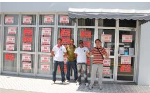
Mobilização foi intensa em todas as agências