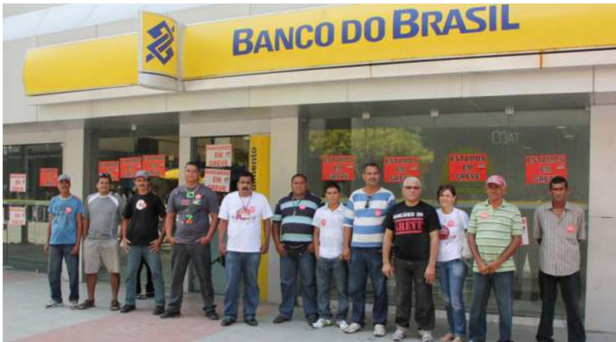
Munidos de muita coragem, unidade e disposição de luta, bancários realizaram a maior paralisação dos últimos 20 anos

Aumento real Valorização do piso PLR maior Mais contratações