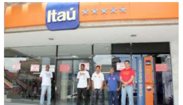
Itaú quis complicar negociações e foi alvo central da greve