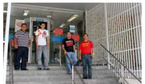
Caixa Rosa da Fonseca manteve tradição, com 100% parado