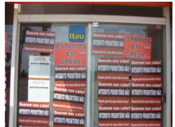
Interditos foram combatidos com mobilização e ações jurídicas