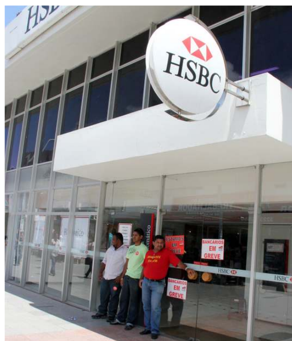
Força da greve isolou o HSBC, que restringiu o atendimento

Diferenças salariais: o reajuste de 9% no salário, nos tíquetes-refeição ou na cesta-alimentação, relativas a setembro e outubro de 2011, serão pagas até a folha de novembro.