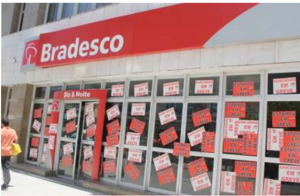
Acostumado a furar greves, Bradesco se deu mal este ano